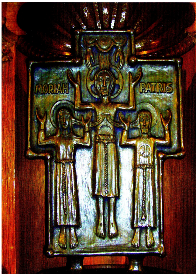
Marie et le disciple bien-aimé au pied de la croix de Jésus. Croix d'autel du Sanctuaire du Mont Moriah, Simmern WW.